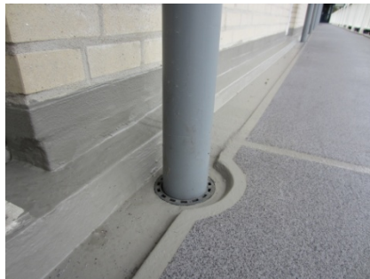
Standleiding, goot en hemelwaterafvoer na de renovatie