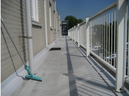
Galerij voor de renovatie