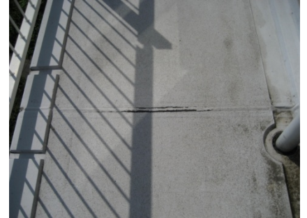
Dilatatie voor de renovatie voorzien van een EPDM plakstrook