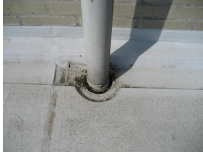
Standleiding, goot en hemelwaterafvoer voor de renovatie