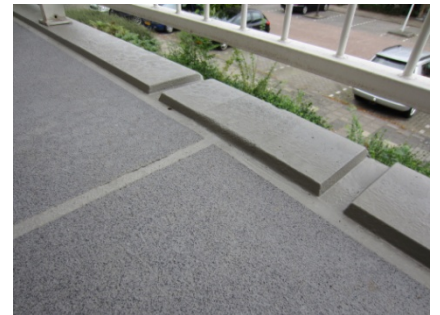
Dilatatie na de renovatie voorzien van het Triflex Cryl R 230 membraan