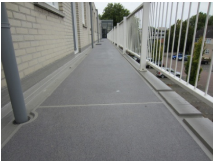
Galerij na de renovatie