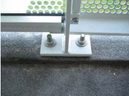
Voor de renovatie: Bevestiging van het hekwerk op de schrobrand.