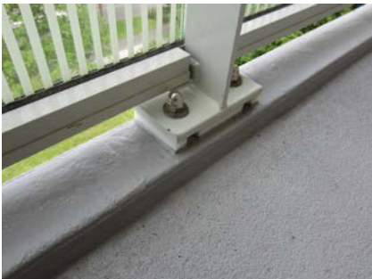
Na de renovatie: Bevestiging van het hekwerk op de schrobrand.