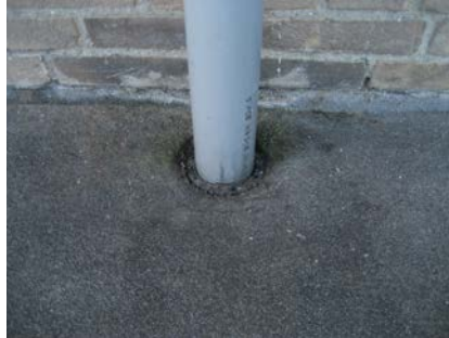
Voor de renovatie: Hemelwaterafvoer en gevelaansluiting