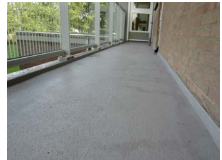
Na de renovatie: De galerij ziet er schoon, mooi en netjes uit.