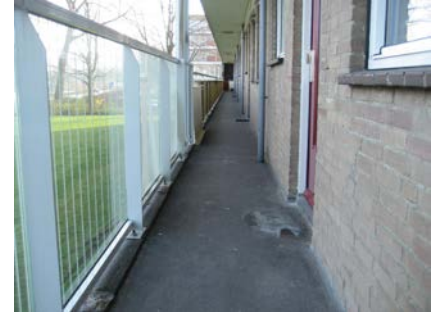
Voor de renovatie: De galerij ziet er vervallen en oud uit.