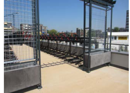
Door gebruik te maken van een dubbeldeks fietsenrek, kunnen op een beperkte ruimte meer fietsen geplaatst worden