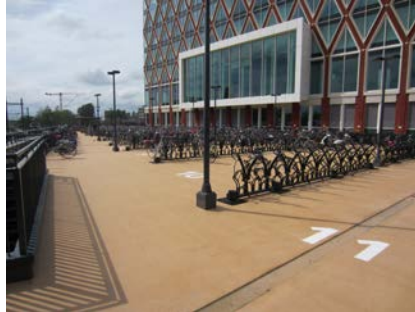
De fietsparkeergelegenheid biedt plaats aan 4.000 fietsen