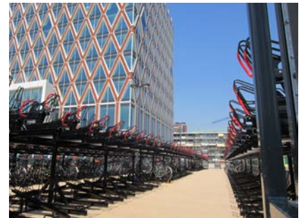
Het eindresultaat: Een prachtig fietsendek met de gewenste uitstraling!