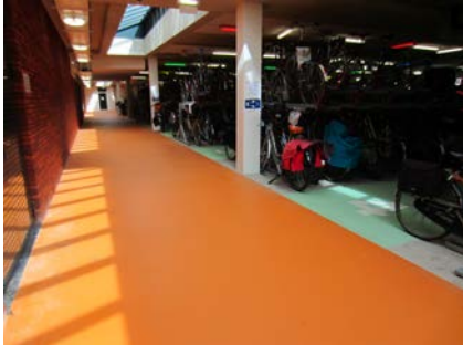
De fietsenstalling op maaiveldniveau