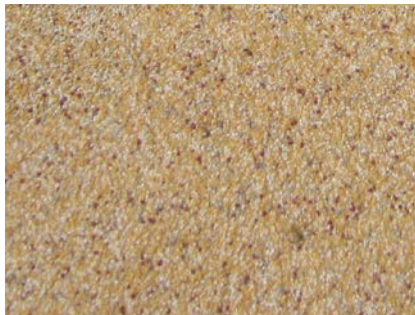
De samenstelling van de "zanderige" instrooiing