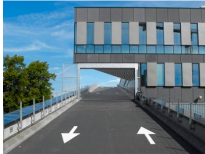
Haagse Hogeschool te Delft