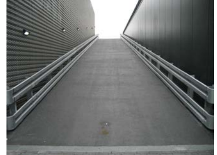
Auto Muntstad te De Meern