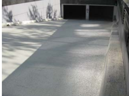
ABN Amro te Amsterdam