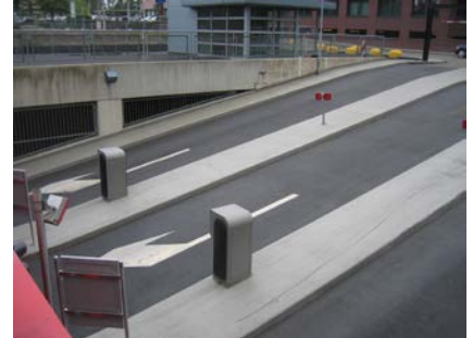
Teleparking te Heerlen