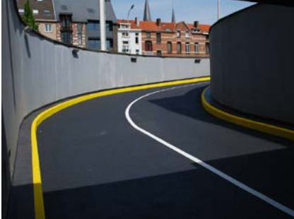
Delhaize te Heverlee