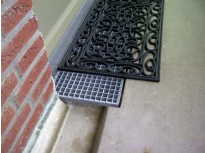
Gootdetail voor de renovatie