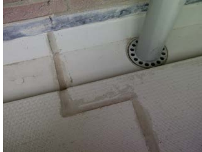
De dilatatie is met een kit-emulsie dichtgezet