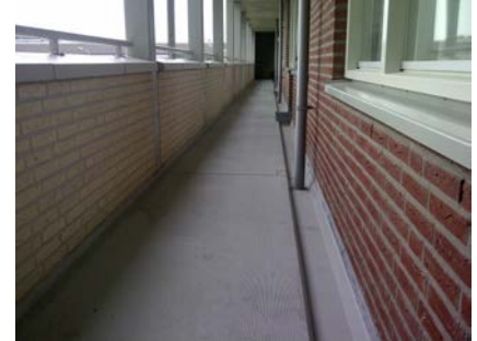
De galerij voor de renovatie: saai, somber en onvoldoende antislip