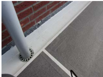
De dilatatie is voorzien van het waterdichte en scheuroverbruggende Triflex membraan