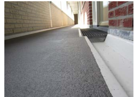
De galerijen in een nieuw jasje; mooi en strak afgewerkt, zoals de bewoners het graag wilden hebben