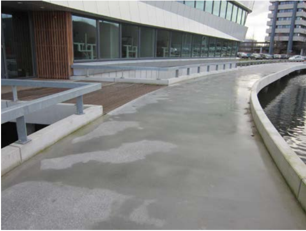
De betonnen wandelbrug werd als glad ervaren.