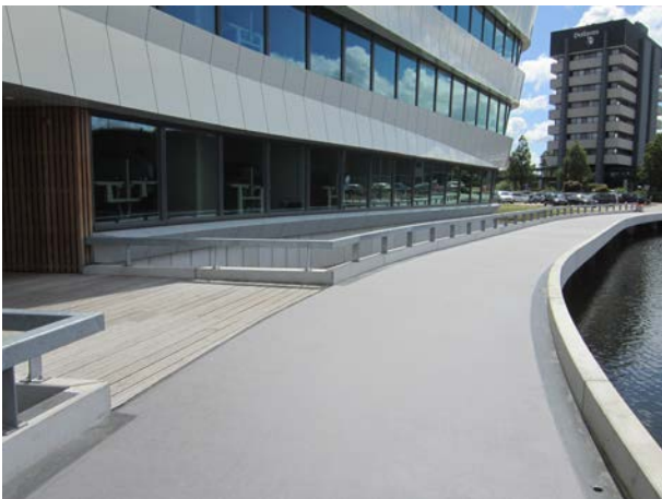
Door het aanbrengen van het Triflex systeem, heeft de wandelbrug de uitstraling en gewenste stroefheid gekregen.