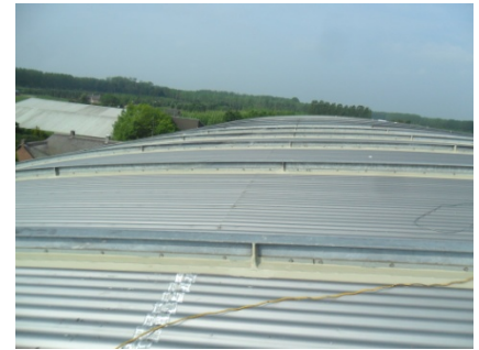
Het eindresultaat ! Een waterdicht dak