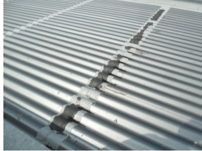
De afdichting bij de aansluiting tussen de platen was niet meer intact