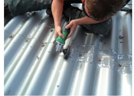
Door middel van slijpen wordt de ondergrond geschikt gemaakt voor het membraan