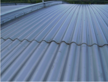
Het stalen dak voor het afdichten met Triflex ProDetail