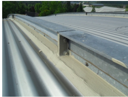
Ook de aansluiting op de stalen constructie is waterdicht afgewerkt