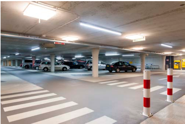
Door het gebruik van de juiste verlichting, voelt de parkeergarage veilig en vertrouwd aan.