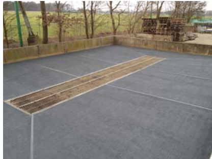
De wasplaats is voorzien van een vloeistofdichte afwerking