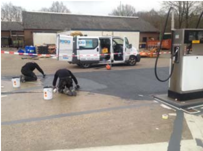
Ook bij de tankplaats wordt het vloeroppervlak van Preco Cryl Reibplastik 2K voorzien