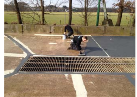
Het aanbrengen van Preco Cryl Reibplastik 2K op een van primer voorziene ondergrond