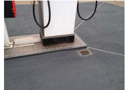
Ook de details zijn in het systeem geïntegreerd