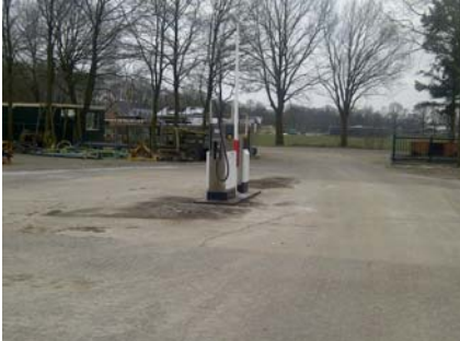
De tankplaats voor de renovatie