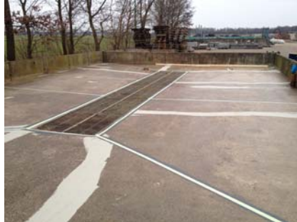
De scheurvorming is voorzien van het scheuroverbruggende Triflex membraan