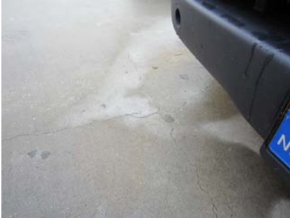
Het parkeerdek vertoonde scheurvorming waardoor lekkageproblemen zijn ontstaan.