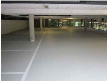
Ook het parkeerdek dat in het pand gesitueerd is, is voorzien van het Triflex ProPark systeem om lekkageproblemen te vermijden.