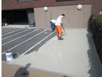
Na het aanbrengen van het waterdichte Triflex membraan werd een slijtlaag aangebracht.