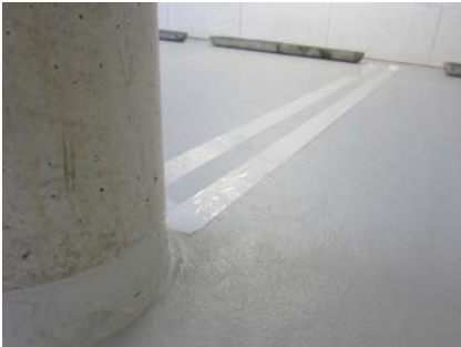
Na het aanbrengen van Triflex Cryl Finish, wordt de belijning aangebracht.