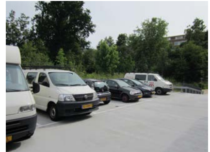
Het eindresultaat! Een waterdicht parkeerdek.