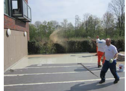
Door deze slijtlaag in te strooien met vuurgedroogd kwartszand ontstaat een voldoende antislip oppervlak.