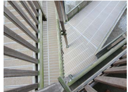
Een duurzame oplossing met een prachtig resultaat op elke verdieping van het wooncomplex!