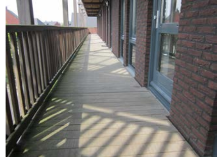
Ook de houten galerijen waren erg glad.