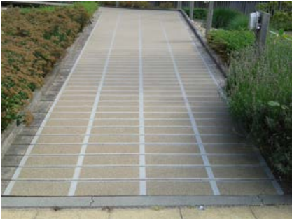
Door het aanbrengen van het Triflex WAS systeem is er niet alleen voldoende anti-slip maar ook de uitstraling is weer naar wens.