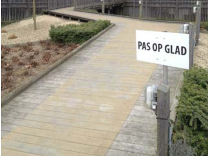
De houten vloerdelen van de entree naar het wooncomplex werden als glad ervaren.