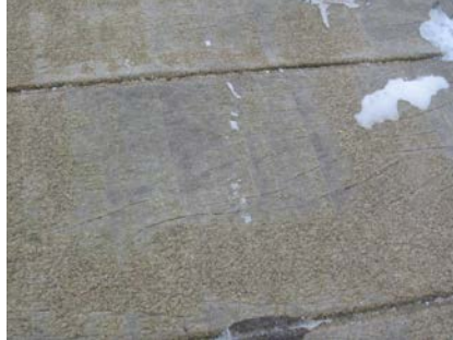
De aanwezig anti-slip laag was op meerdere plekken volledig verdwenen.