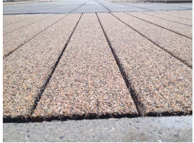
Kwartzand zorgt voor voldoende antislip.