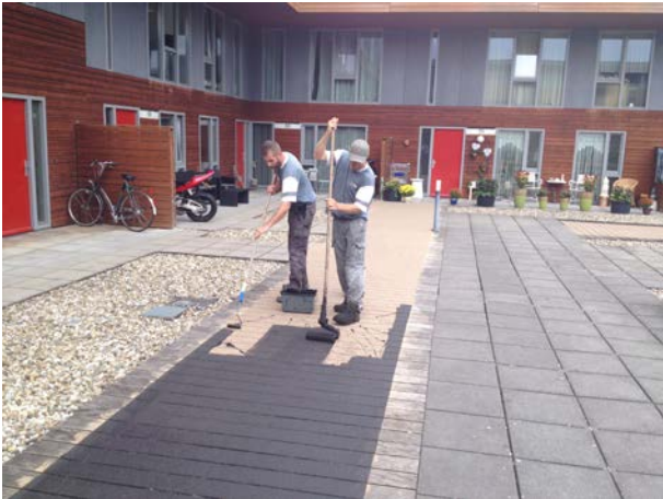
Als verzegeling wordt een kleurfinish aangebracht.