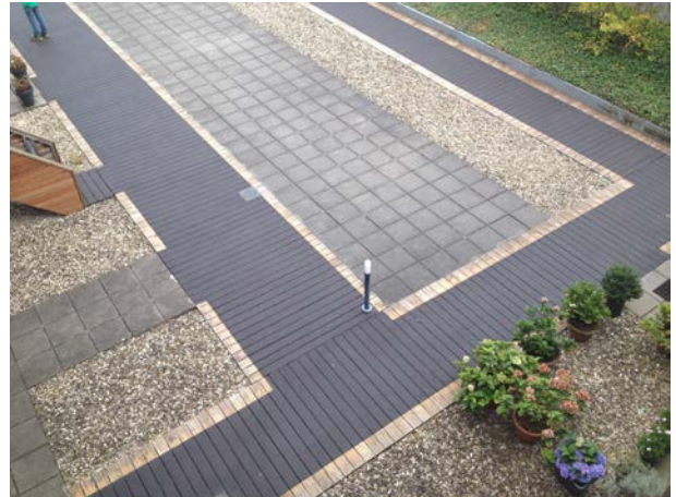
Het eindresultaat! Een veilig wandeldek.