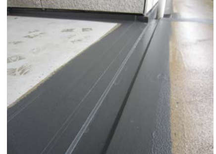
De dilataties zijn voorzien van het waterdichte Triflex membraan.