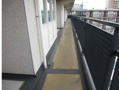
Het vloerveld is voorzien van Triflex Cryl Primer.