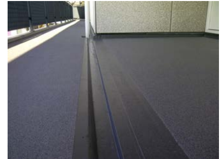
Het eindresultaat: Een mooi, strak en modern uitzijende galerij.