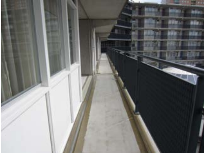
Het coatingsysteem is verwijderd om een geschikte ondergrond te creëren.