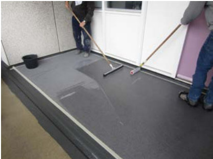
Als laatste laag wordt Triflex Cryl Finish Satin aangebracht als verzegeling van het systeem.