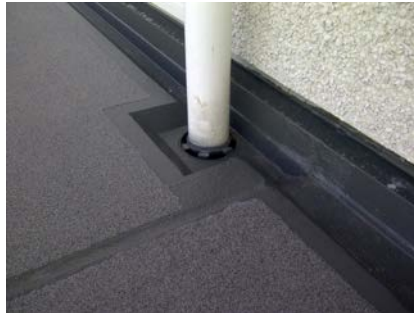
De goot, hemelwaterafvoer, dilataties en opstanden zijn afgewerkt in RAL 7043 verkeersgrijs.