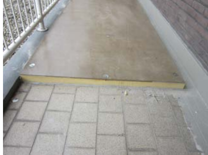
Om de hoogteverschillen weg te nemen, is gebruik gemaakt van het Triflex BIS systeem.