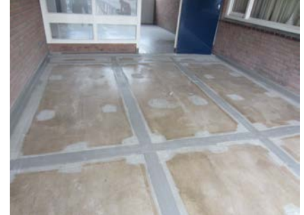
Om het Triflex BIS systeem waterdicht af te werken zijn de plaatnaden voorzien van een Triflex membraan.