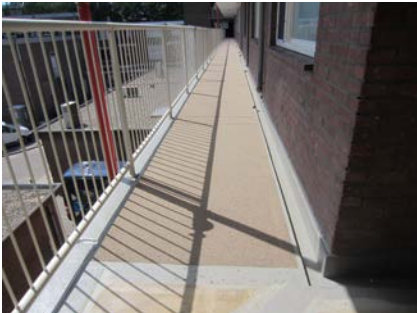
Om valpartijen in de toekomst te voorkomen wordt een antisliplaag aangebracht.