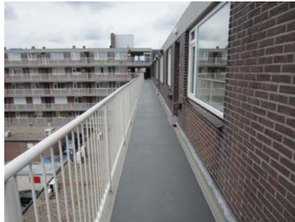
Het systeem kan in elke gewenste kleur worden afgewerkt.