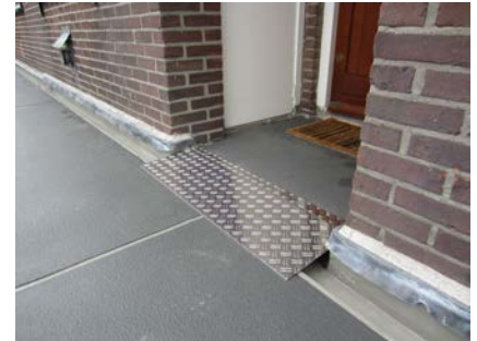
De niveauverschillen zijn weggenomen. Bewoners kunnen hun woning weer makkelijk bereiken.