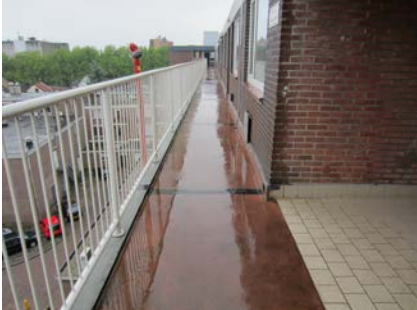
Bij nat weer worden de galerijen erg glad.