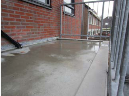
De balkons raakten verweerd en glad.