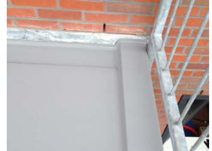
Het systeem sluit naadloos aan op de gevel.