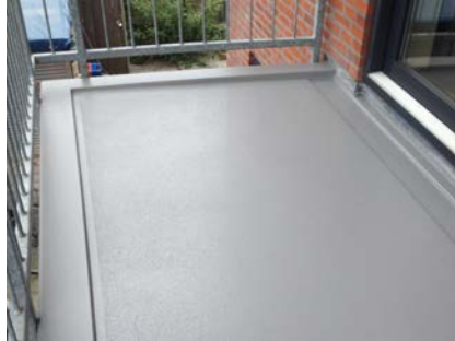
Door het aanbrengen van het 2-laags Triflex BAS systeem zijn de problemen opgelost.