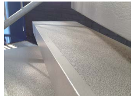
Het vloerveld is ingestrooid met kwartszand, waardoor deze weer voldoende antislip heeft.