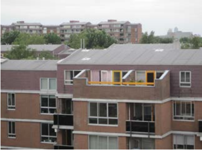
Het dakoppervlak voor het aanbrengen van de veiligheidsmarkering