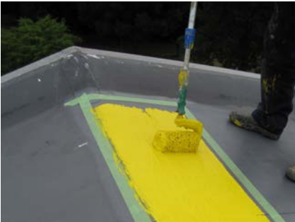
Voldoende laagdikte gebruiken voor een volledige uitharing