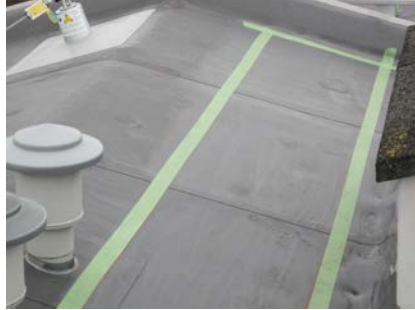
Afplakken van het oppervlak