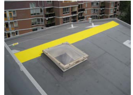
Het eindresultaat !