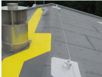
Het eindresultaat – met het vloeibare product is het mogelijk om langs alle dakdetails te gaan