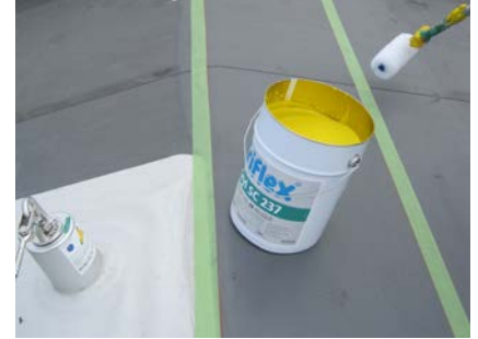
Triflex Cryl SC 237 aanbrengen met een vachtroller