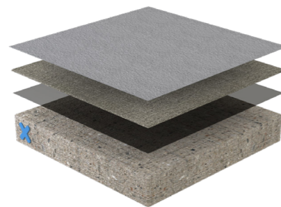
TRIFLEX BAS-SYSTEEM, 3 LAAGS

Vragen of meer informatie? We horen het graag!