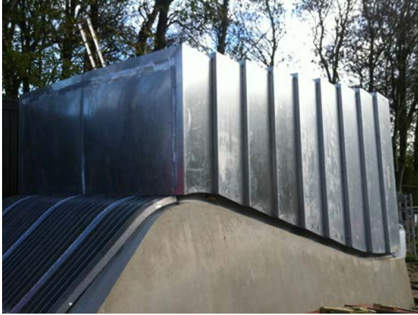
Het stalen raamwerk met aluminium beplating in een zigzag patroon.