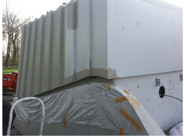
Het zigzagpatroon wordt zorgvuldig voorzien van Triflex ProDetail.