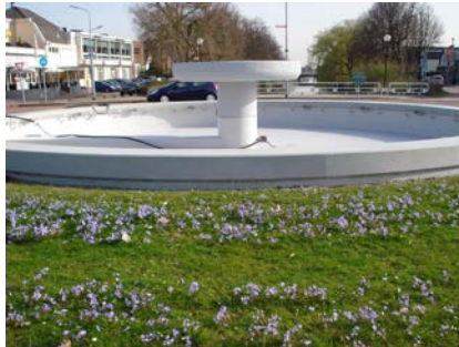
De fontein voorzien van diverse Triflex systemen