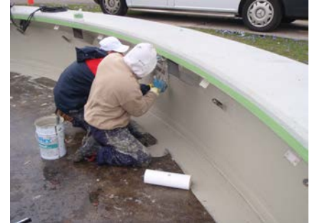
De randen worden voorzien van het Triflex ProDetail membraan