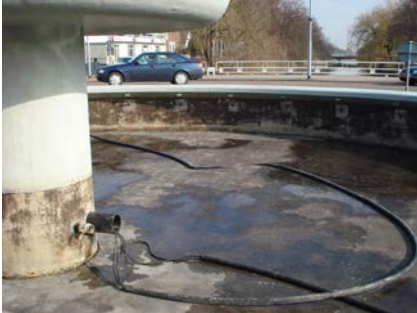
De fontein voor de renovatie