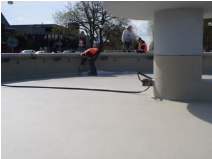
Hier wordt de fontein voorzien van het Triflex ProTect membraan