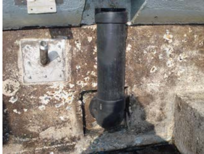
Detailaansluitingen die voorzien worden van het Triflex ProDetail membraan