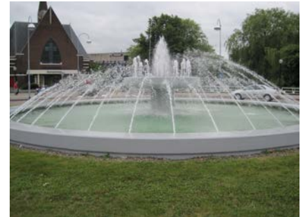
Het eindresultaat !